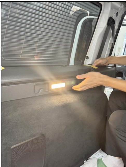
下側のアッパートリムを外します