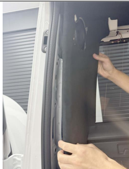
後ろ側のトリムを外します