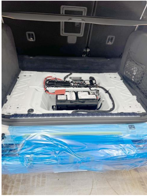
ラゲッジルームのカーペットを外します