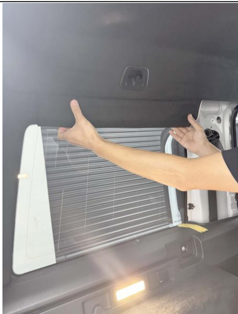
上側のトリムを外します