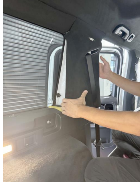
前側のトリムを外します